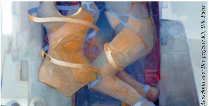
Ausschnitt aus: Das perfekte Ich, Ulla Faber