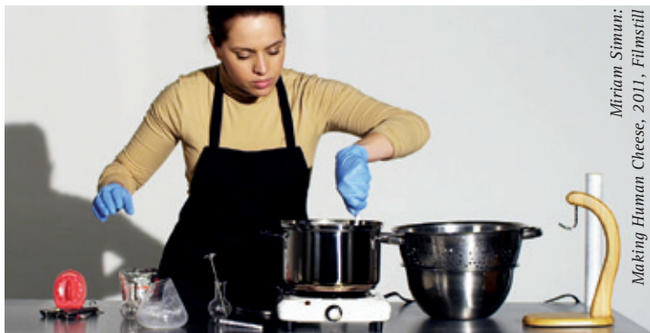
Miriam Simun: Making Human Cheese, 2011, Filmstill

Treffpunkt: Wilhelm-Hack-Museum Berliner Straße 23